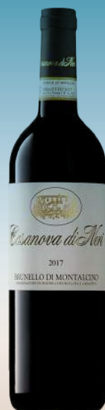
Брунелло ди Монтальчино Казанова ди Нери Тоскана, Италия