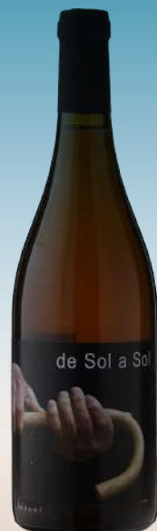
Де Соль а Соль Натураль Айрен Рансьо Испания, Кастилия