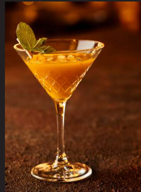
Mango Tini 120мл/370₽