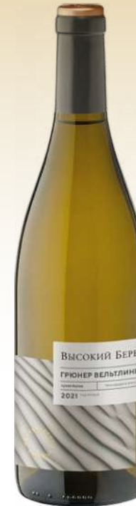
Высокий берег Грюнер Вельтлинер, Россия / Vysoki Bereg Grüner Veltliner, Russia

Вино светло-соломенного цвета. Отличается богатым, насыщенным, но элегантным и утонченным вкусом с фруктово-ягодными тонами, свежей кислотностью и округлым, сбалансированным послевкусием. У вина яркий, но очень нежный аромат, в котором гармонично переплетаются тона красных ягод, косточковых и цитрусовых фруктов.