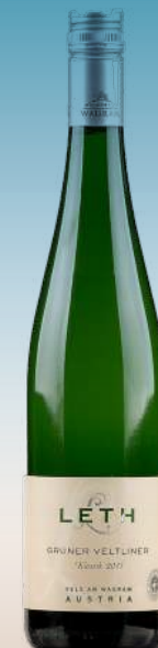
Лет, Грюнер Вельтнер Австрия