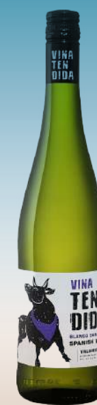
Винья Тендида Валенсия, Испания