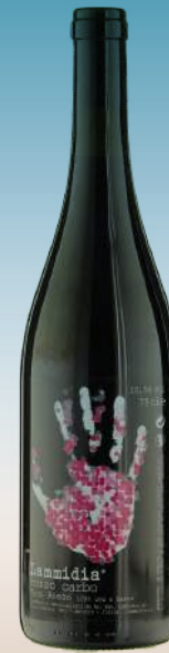
Ламмидия Россо Карбо Абруццо, Италия