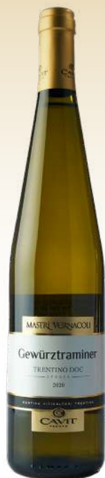
Кавит Мастри Вернаколи Гевюрцтраминер, Тренти- но-Альто Адидже, Италия /Cavit «Mastri Vernacoli» Gewurztraminer, Trentino, Italy