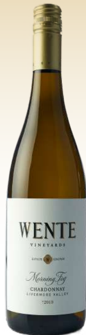
Венте Виньярдс Монинг Фог Шардонне, Калифорния, США /Wente Morning Fog Chardonnay, California, USA

Выразительный аромат вина соткан из оттенков специй, экзотических фруктов и лепестков розы. Вкус вина – приятный, сухой, округлый, с хорошо сбалансированной кислотностью и великолепной текстурой.