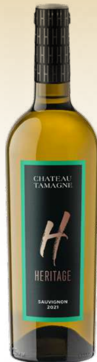
Шато Тамань Эритаж Совиньон Блан, Россия / Chateau Tamagne Heritage Sauvignon, Russia

Это напиток для особых, торжественных моментов. Вино обладает гармоничным, сбалансированным и благородным вкусом, аромат наполнен оттенками спелых фруктов и красных ягод.