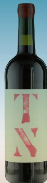
Партида Креус Испания, Каталония