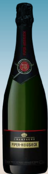
Пайпер Хайдсик Брют Винтаж Шампань, Франция