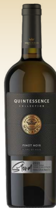
Квинтэссенция Шторм Пино Нуар. Кубань, Новороссийск. / The Quintessential Storm Pinot Noir. Kuban, Novorossiysk.

Вино в бокале светло-соломенного цвета с зеленоватыми оттенками. Аромат вина характерный сортовой, с нотками смородины. Вкус вина освежающий, гармоничный.