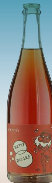
Домен де л'Окта- вин, "Бетти Бабблз" Франция, Бургундия