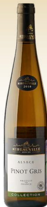
Кав де Рибовиль Пино Гри, Эльзас, Франция / Cave de Ribeauville Pinot Gris, Alsace, France

Классика американского шардоне. Вино частично выдержано в дубе, что придаёт ему тона ванили, сливочного масла, жареных тостов. Вино обладает плотной, обволакивающей структурой со сбалансированной кислотностью, а во вкусе доминируют тропические фрукты.