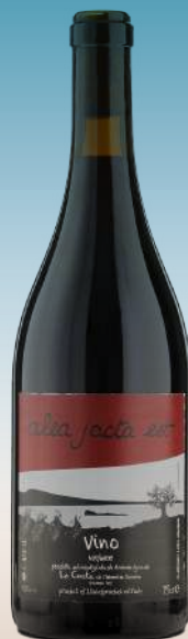
Ле Косте, "Алеа Джакта Эст" Италия, Лацио