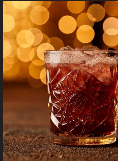
Agatha Christie 350мл/440₽