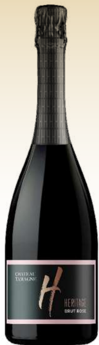
Шато Тамань Эритаж Брют Розе, Россия / Chateau Tamagne Heritage Brut Rose, Russia