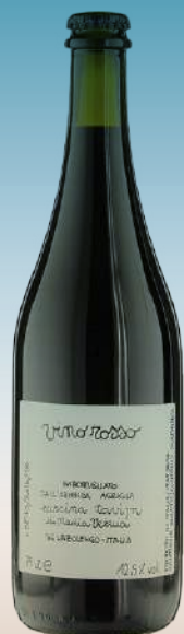
Кашина Тавиин Италия, Пьемонт