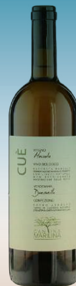
Кантина Мари- лина, "Кье" Италия, Сицилия