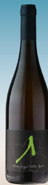
Кtima Лигас Ламда Македония, Греция