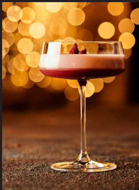
Clover Club _____ 160мл/410₽