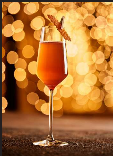
Caesar Cherry _____ 160мл/540₽