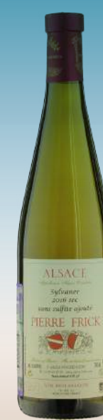
Сильванер Пьер Фрик Эльзас, Франция