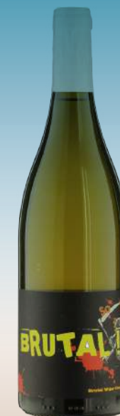
Домен де л'Окта- ван Брутал Франция, Бургундия