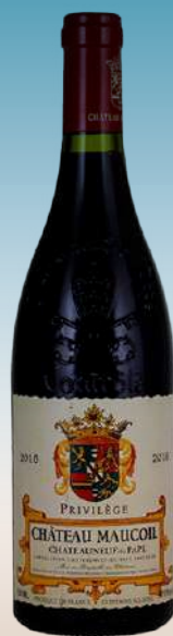
Шато- неф-дю-Пап Шато Мокуаль Привилеж Долина Роны, Франция