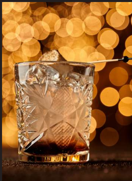
Brambl _____ 350мл/430₽