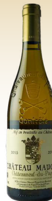
Шато Мокуаль Шатонёф-дю-Пап, Долина Роны, Франция /Chateau Maucoil Chateaufeu du Pape, France

Щедрый, мягкий и сбалансированный вкус вина обладает шелковистой текстурой, сладковатыми тонами спелых желтых фруктов, персика, меда и пряным, имбирно-перечным послевкусием.