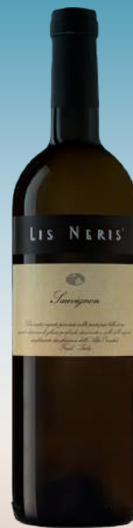
Совиньон Изонцо Бианко Лис Нерис Фриули, Италия