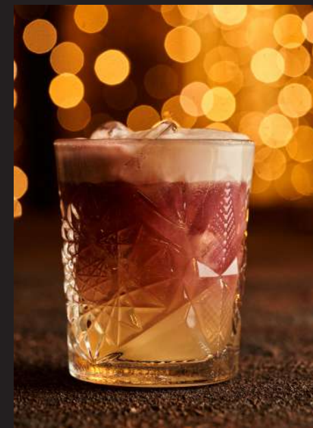
New York Sour _____ 350мл/410₽